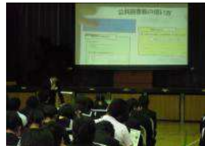
＜図書館活用の学習会＞

本年度は、新宿区中町図書館の学芸員の方をお招きし、「図書館の活用と調べ学習の進め方」についての学習会を実施した。